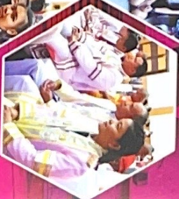
สมัครเรียนออนไลน์